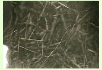
ラドン (トロン) ガスからの放射線