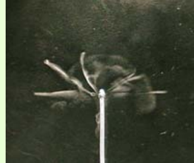
ウラン鉱石からの放射線