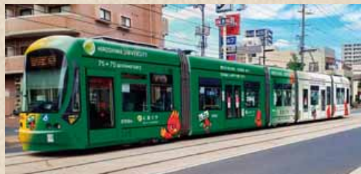
ラッピングされた路面電車(イメージ図)